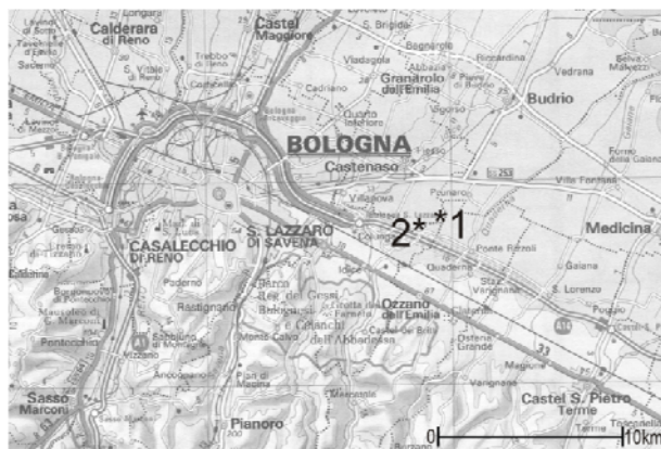
Fig. 1. Posizionamento dei siti Riola (1) e Stanga (2).

I materiali esaminati provengono esclusivamente da raccolte di superficie.