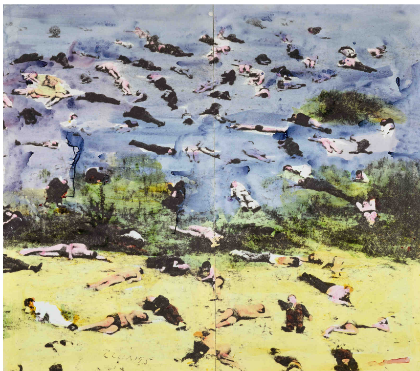
Fig. 2. M. Schifano, Tutti morti , 1970. Smalto alla nitro su tela emulsionata, cm 195x220, collezione privata