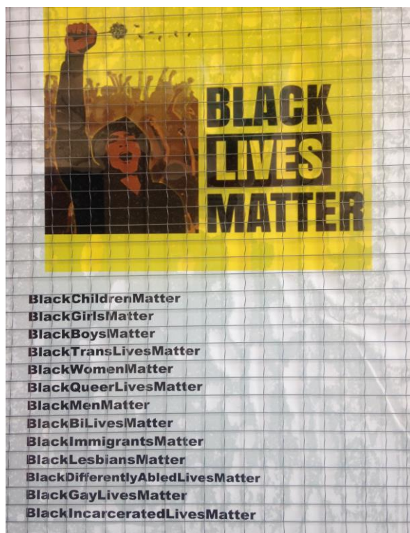
Figura 1 – Un cartello esposto all'ingresso di una scuola primaria e una slide di una formazione interna per insegnanti