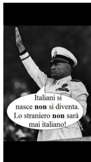
Immagini 2 e 3 – Italiani compatti