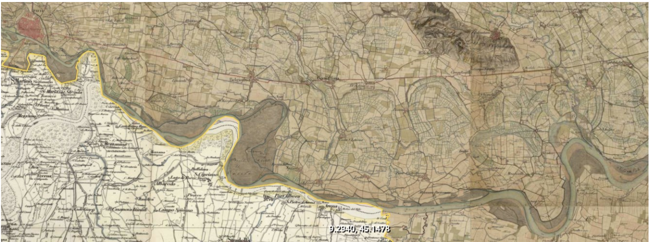
Img. 1 L'area di Muzzana nella cartografia del XIX secolo.

A livello locale l'iniziativa economica di Regina è contrassegnata, in maniera piuttosto evidente, da una volontà di unificazione spaziale in cui sicuramente ha un ruolo l'innegabile ambizione personale. Regina, a seguito anche delle concessioni di Bernabò del 1380 17 , pare procedere verso l'instaurazione di una possessione costituita da beni immobili e diritti, con la concretizzazione di spazio di potere privato. La ricostruzione degli eventi che hanno portato alla decisione di acquistare svariati ettari di terra a Muzzana, però, non è da leggere tramite una spiegazione monocausale, come una 'semplice' volontà di unificare i terreni concessi dal marito: il legame di Regina con la zona, infatti, è precedente alle donazioni, è il caso, per esempio, degli investimenti nell'area di Bissone 18 . Quello che è possibile affermare, allargando lo sguardo, è che l'area posta tra Pavia e Piacenza giocava un ruolo importante nella gestione dei possedimenti: ogni acquisto di terre da parte della domina è un modo per influenzare e far percepire – fisicamente e nell'immaginario – la vicinanza della famiglia viscontea 19 .